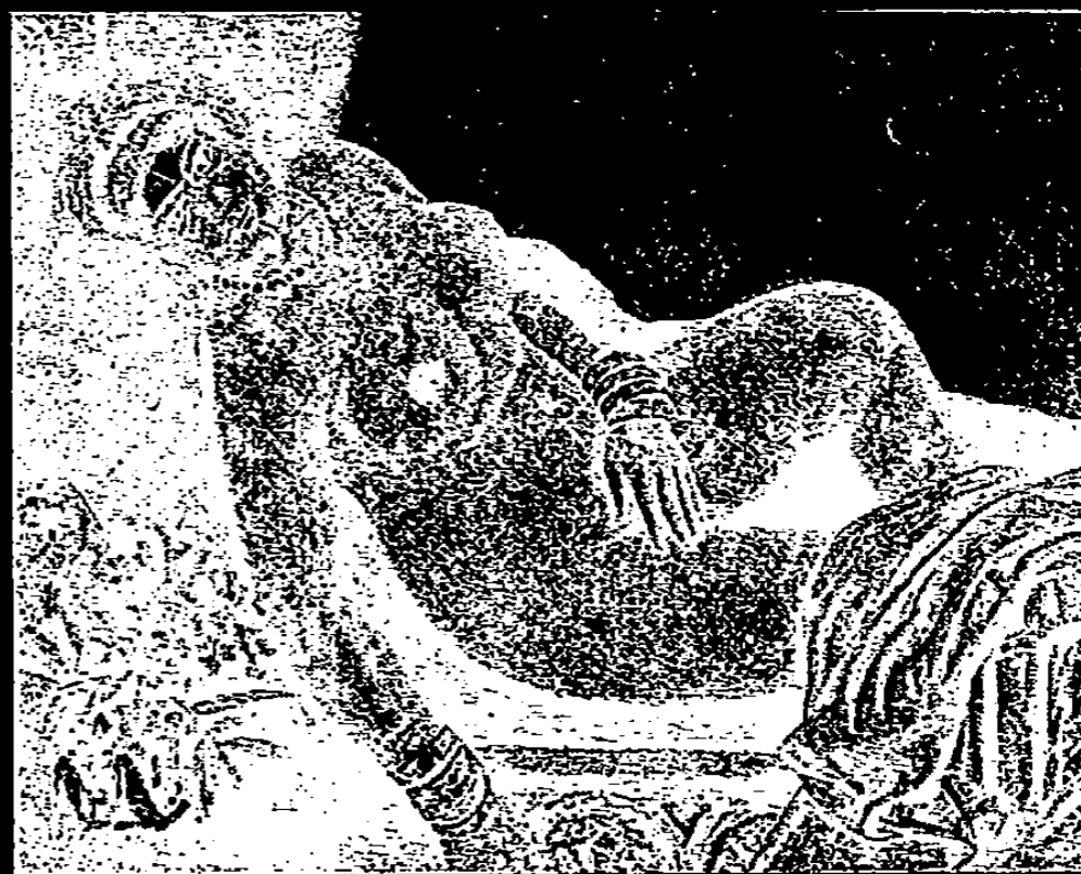
J. MIGONNEY. Vénus orientale . (Musée d'Alger).

Nous aurons l'occasion de revenir sur l'intérêt des collections artistiques du Musée des Beaux-Arts d'Alger (1). Nous tenons à