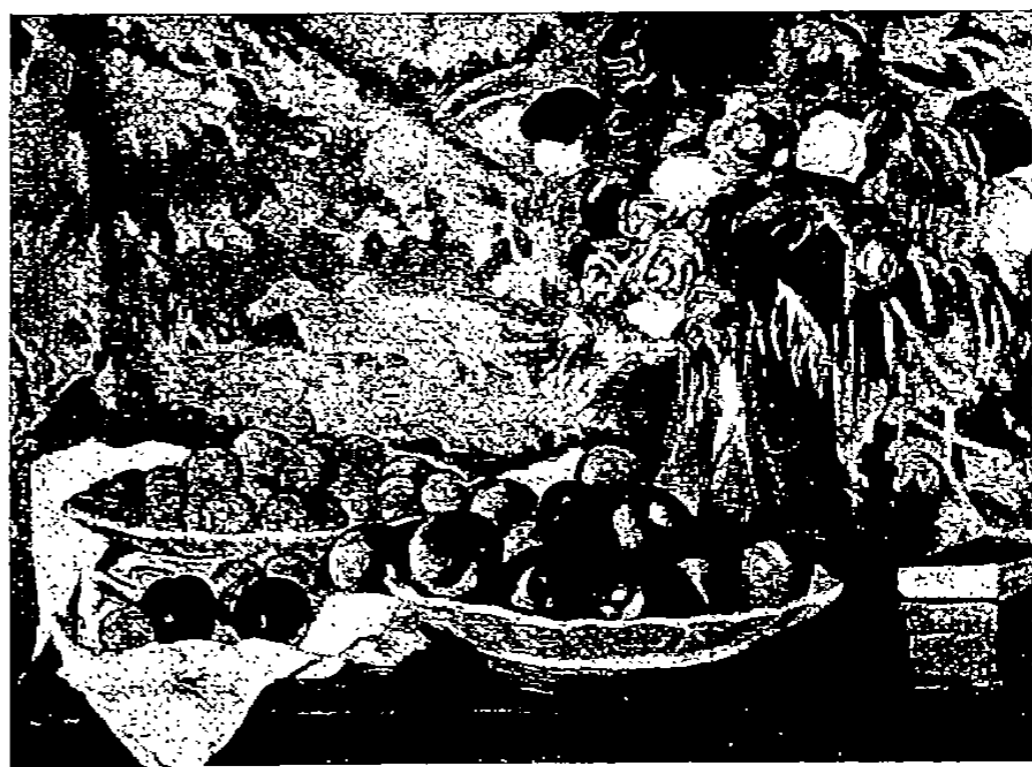
MAURICE DENIS. Fleurs et fruits. (Musée de Lyon).